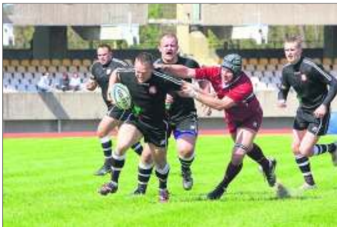
Lietuvos regbininkai (juoda apranga) Kaune sutriuškino Latvijos rinktinę.

Nuo šių metų visų Lietuvos regbio rinkinių vizitine kortele taps aikštėje dėvima juoda sportinė apranga. Su sėkmę lemiančia spalva nacionalinė vyrų ekipa Europos čempionato mače 57:3 nušlavė latvius.